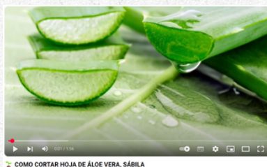
COMO CORTAR HOJA DE ALOE VERA, SÁBILA

Mira este video de cómo cortar la sábila, cliquea sobre la imagen