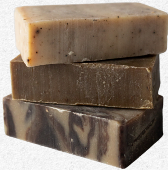
JABONES ARTESANOS CON GLICERINA Y SOBREENGRASADO. SIN CONSERVANTES

Todos los jabones artesanos contienen un 11% de glicerina producida de forma natural durante la saponificación