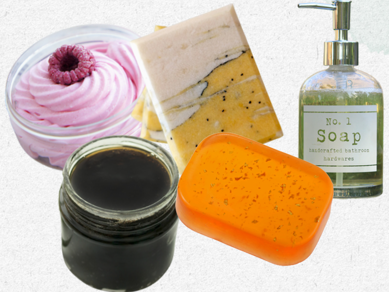
JABONES ARTESANOS CON GLICERINA, EN CREMA, EN PASTA (BELDI), LÍQUIDO, EN BARRA SÓLIDO Y BASE DE GLICERINA, SÓLIDO Y LÍQUIDO.

La variedad de texturas de jabones que puedes conseguir saponificando grasas es enorme, y la mayoría se consigue con la técnica de Hot Process o saponificación en caliente.